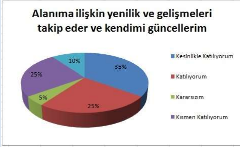
Grafik 5: Alanıma ilişkin yenilik ve geliřmeleri takip eder ve kendimi güncellerim.

“Alanıma iliřkin yenilik ve geliřmeleri takip eder ve kendimi güncellerim.” Sorusuna ankete katılan öđretmenlerin toplamda %60’ı Katılıyorum yönünde olumlu görüř belirtmiřlerdir.