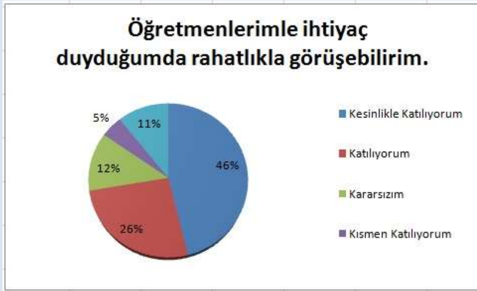
Grafik 2: “Öğretmenlerimle ihtiyaç duyduğumda rahatlıkla görüşebilirim.”

“Öğretmenlerimle ihtiyaç duyduğumda rahatlıkla görüşebilirim.” sorusuna ankete katılan öğrencilerin %72’si Katılıyorum yönünde görüş belirtmişlerdir.