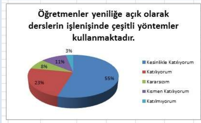
Grafik 3: “Öğretmenlerin Yeniliğe Açıklığı.

“Öğretmenler Yeniliğe Açık Olarak Derslerin İşlenişinde Çeşitli Yöntemler Kullanmaktadır.” sorusuna ankete katılan öğrencilerin %78’i Katılıyorum yönünde görüş belirtmişlerdir.