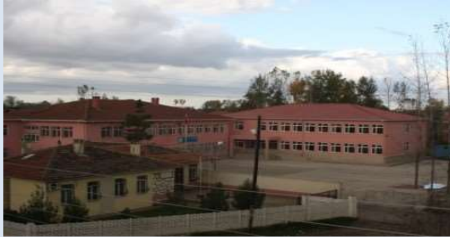
2008- 2009 Eğitim Öğretim Yılında Yeni Ek Binamız Yapıldı.