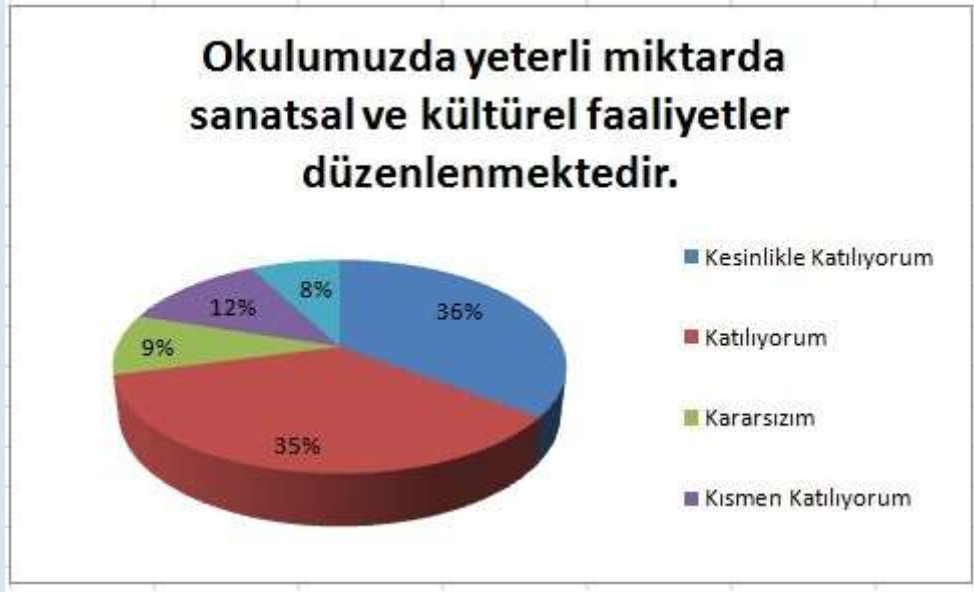
Grafik 7: Sanatsal ve Kültürel Faaliyetler

“Okulumuzda yeterli miktarda sanatsal ve kültürel faaliyetler düzenlenmektedir.” sorusuna ankete katılan velilerin toplamda %71’i Katılıyorum yönünde olumlu görüş belirtmişlerdir.