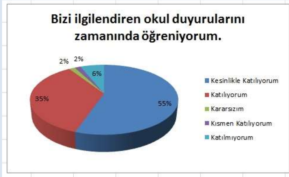
Grafik 6: Okul Duyurularının Zamanında Öğrenilmesi.

“Bizi ilgilendiren okul duyurularını zamanında öğreniyorum.” sorusuna ankete katılmış olan velilerin %90’ı olumlu yönde görüş belirtmişlerdir.