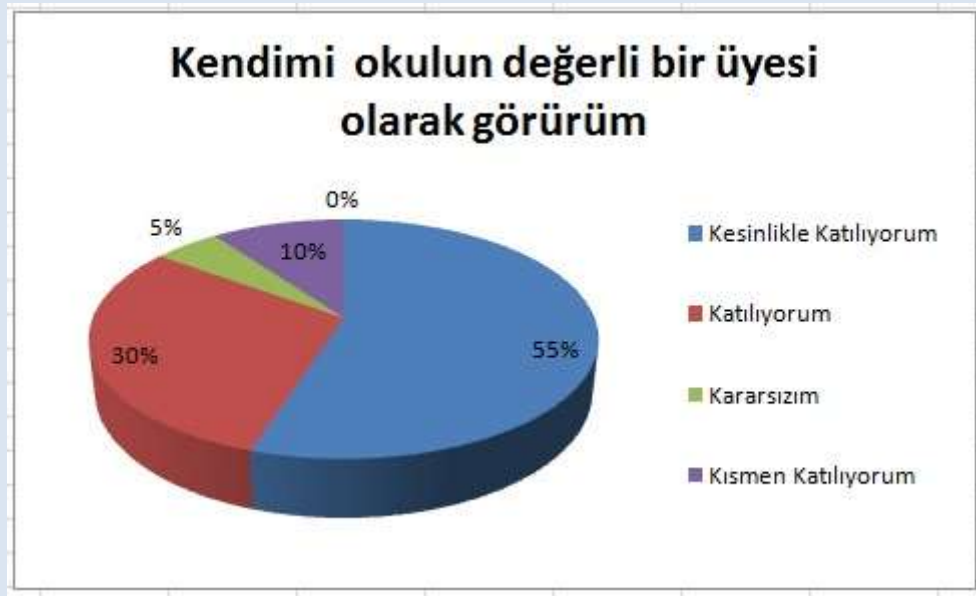
Grafik 4: “Kendimi, okulun değerli bir üyesi olarak görürüm.

“Kendimi, okulun değerli bir üyesi olarak görürüm.” Sorusuna ankete katılan öğretmenlerin toplamda %85’i Katılıyorum yönünde olumlu görüş belirtmişlerdir.